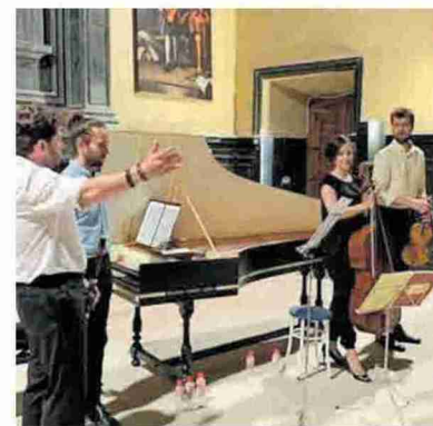
► La Guirlande estará en el Foro de Zaragoza.