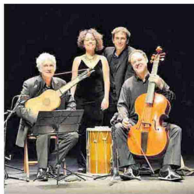
► Ilerda Antiqua actúa en Monzón.