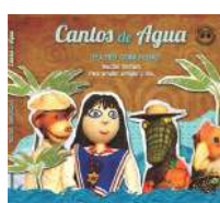
Cantos de agua- 2014