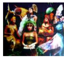
Comadre Araña- 2007